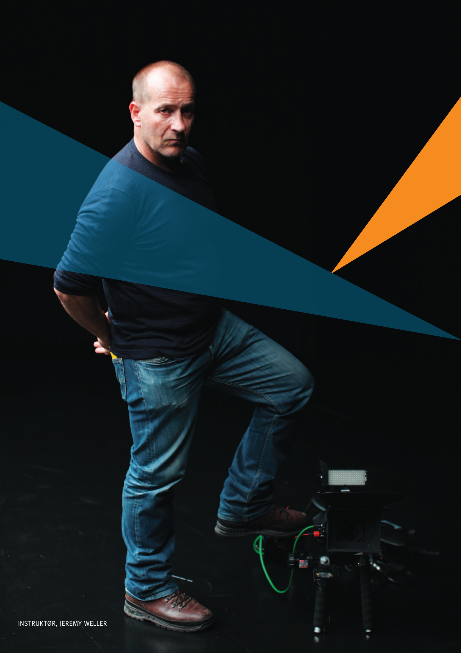
INSTRUKTØR, JEREMY WELLER